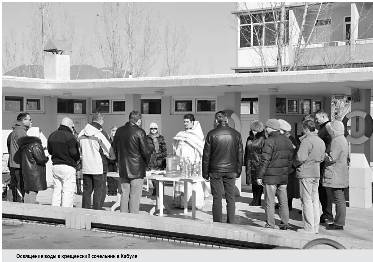
Освящение воды в крещенский сочельник в Кабуле