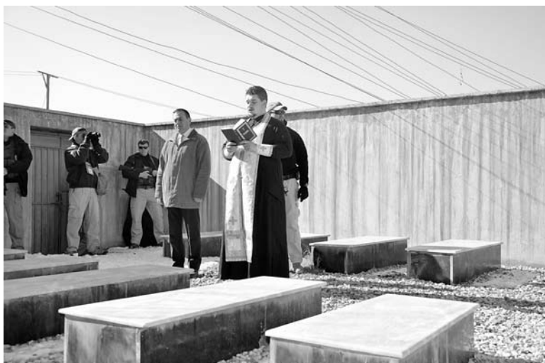
Панихида в Кабуле о воинах, павших на афганской земле

Но несмотря на всю торжественность празднований, разумеется не были забыты и те наши соотечественники, кто пал на этой далекой враждебной земле. В память о них на территории посольства установлен памятник. Здесь, 9 января, была совершена