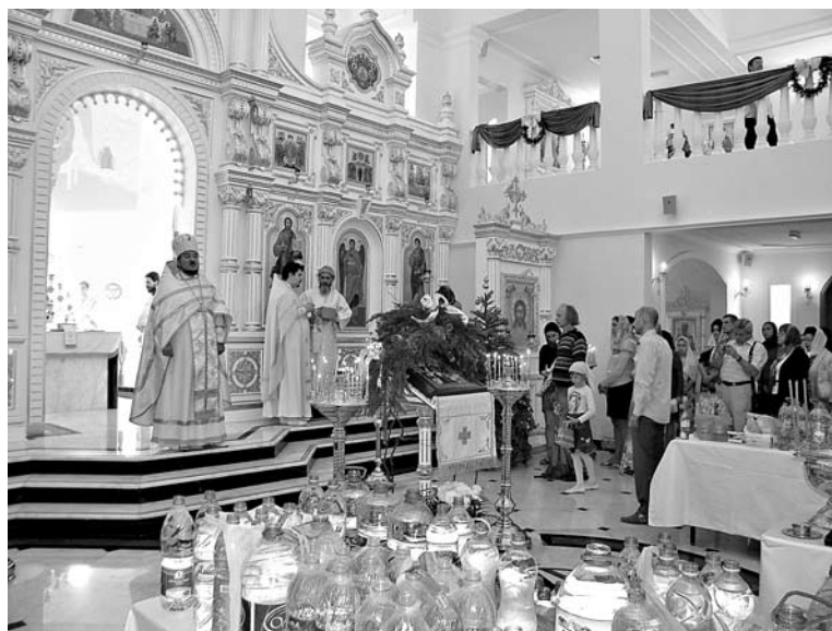
Архимандрит Александр (Заркешев) на Божественной литургии в храме в Абу-Даби

«На небесах более радости будет об одном грешнике кающемся, нежели о девяти праведниках, не имеющих нужды в покаянии» (Лк. 15: 7). Отрадно, что люди, оказавшись на чужбине, порой,